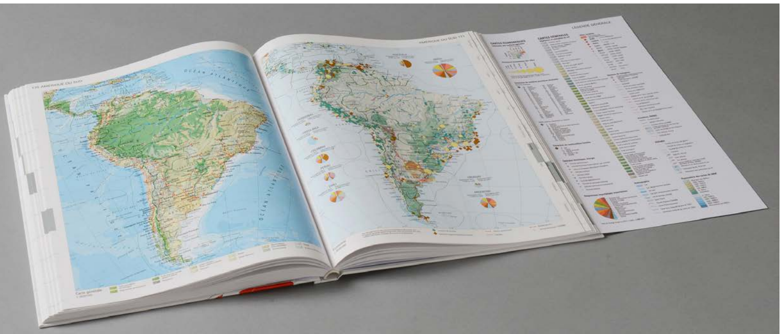
Vergleich zwischen Übersichtskarte und Wirtschaftskarte mit ausgeklappter Generallegende Comparaison entre carte générale et carte économique avec la légende générale dépliée