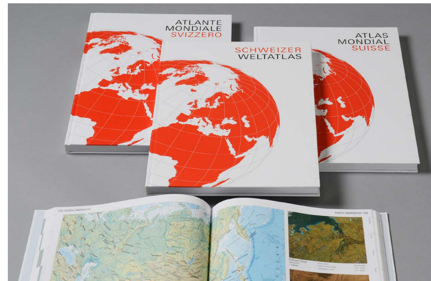
Die Neuauflage des «Schweizer Weltatlas» in drei Sprachen und neuem Erscheinungsbild La nouvelle édition de l'«Atlas Mondial Suisse» en trois langues et sa nouvelle identité visuelle

Les questions concernant les commandes de l'ouvrage sont à adresser directement à l'éditeur Lehrmittelverlag Zürich ( www.lmvz.ch ).